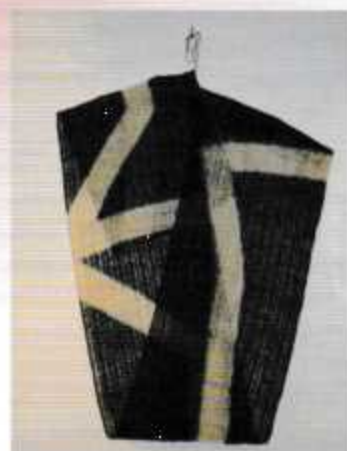
藍からもらうもの