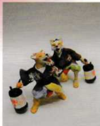
狐の嫁入りーその2