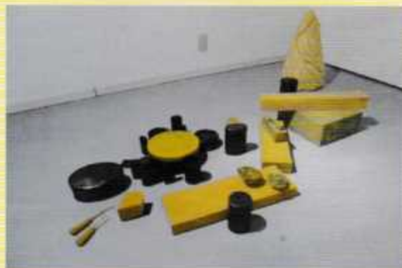
美らかいは狭い。冷たいは暖かい。