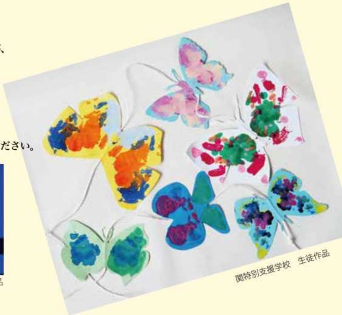
関特別支援学校 生徒作品

特別支援学校アート展の第3回となる今回は、各学校の児童生徒たちが、「動物」をテーマに制作したアート作品をご覧ください。 また、今回新たに、岐阜県高等学校文化連盟のご協力により、平成 29 年度全国高等学校総合文化祭（宮城県）に出品した優秀作品を同時に展示します。 さらに、特別支援学校と高等学校美術部の生徒がコラボレーションする企画もあり、盛りだくさんの内容となっておりますので、ぜひお越しください。