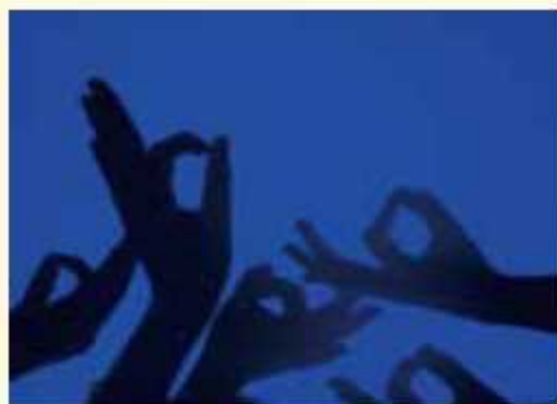
岐阜聾学校 生徒作品