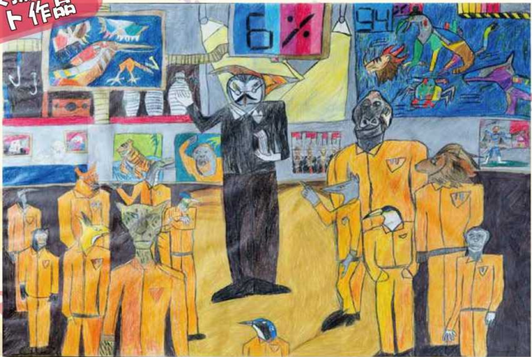
各務原特別支援学校 生徒作品