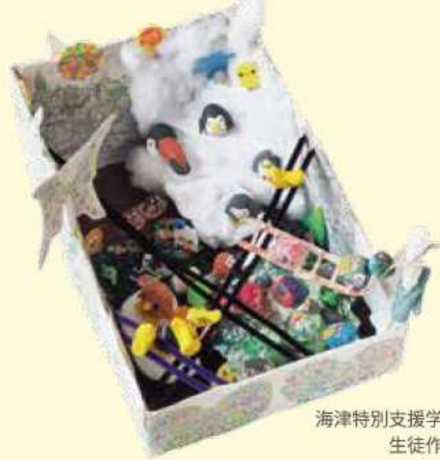
海津特別支援学校 生徒作品