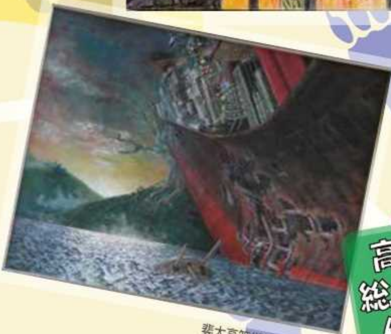
斐太高等学校 生徒作品