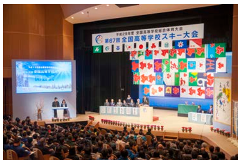
全国高等学校スキー大会 開会式