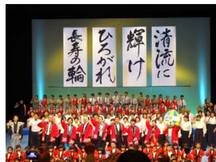
ねんりんピック2020設立総会