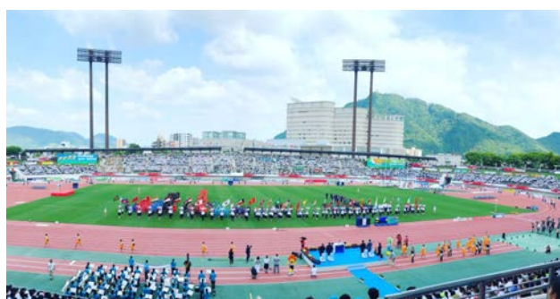
アジアジュニア陸上競技選手権大会 開会式