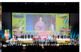
全国農業担い手サミット in 岐阜