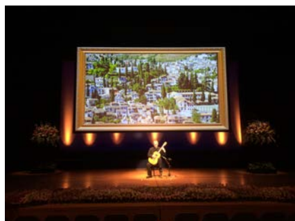
岐阜県芸術顕彰奨励授賞式