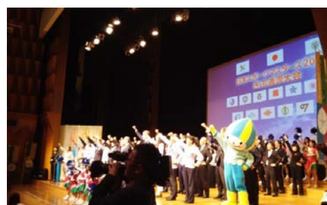
スポーツマスターズスタートアップ