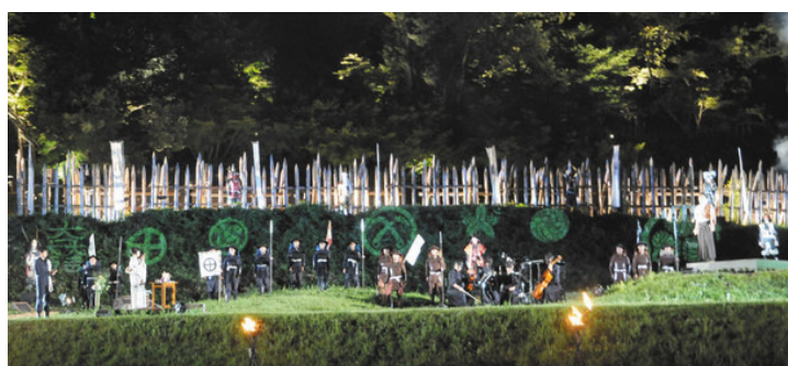
関ヶ原ナイト2018 夏の夜の関ヶ原