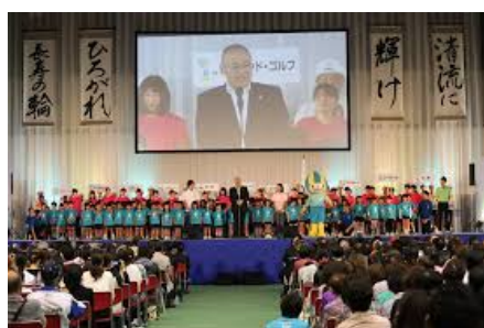
レクフェス&ねんりん&フラッグツアー