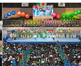
全国レクリエーション大会 in 岐阜「開会式」